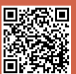
繳交學費及申請學費減免