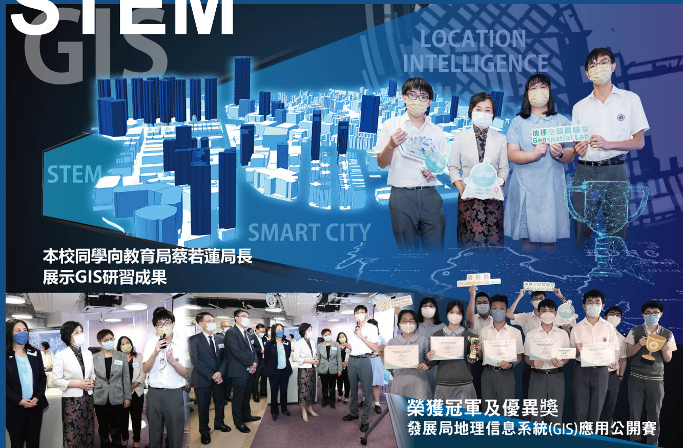
本校同學向教育局蔡若蓮局長展示GIS研習成果