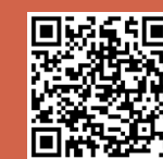
小學校長推薦計劃及獎學金申請表